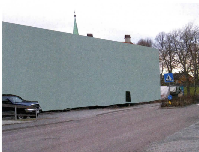
Laurvig hospital fra 1760. Larviks parallell til baroniet Rosendal troner som et slott over den lave trehusbebyggelsen i bydelen Torstrand. En moderat forståelse av byplanens bestemmelser kan resultere i noe som ligner montasjen til høyre.