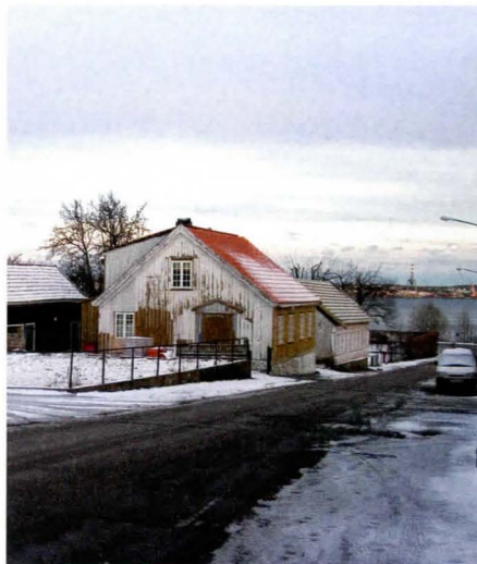
Langesgate på Langestrand. Et vakkert kvartal som ånder av lokal og nasjonal historie. Spennvidde fra grevens oberinspektør til verkets masmester som rundt 1800 bodde i trehuset midt i bildet til venstre. En moderat forståelse av byplanen medfører montasjen til høyre.

god, men for meg ser det ikke ut til at de har klart det de har ønsket.